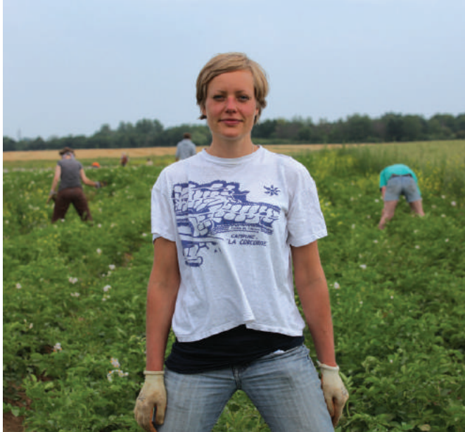
© 10 Billion, what's on Your Plate ?